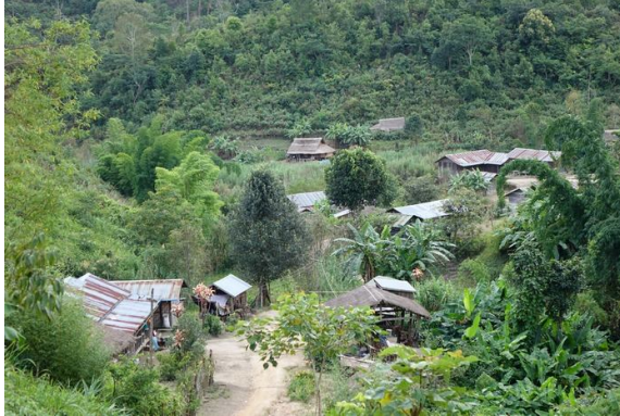
ค่ายผู้พลัดถิ่นคอตาย

คอตายเป็นหนึ่งในหกค่ายผู้พลัดถิ่นในประเทศตามแนวพรมแดนรัฐฉาน-ไทย ซึ่งชายแดนทั้งหมดนี้เป็นที่พักพิงของผู้พลัดถิ่นในประเทศกว่า 6,000 คน ส่วนใหญ่เป็นผู้หญิงและเด็ก แหล่งทุนระหว่างประเทศได้ตัดความช่วยเหลือด้านอาหารให้กับผู้พลัดถิ่นเหล่านี้ตั้งแต่เดือนตุลาคม 2560 แม้ที่ผ่านมาจะมีการตรึงกำลังทหาร และมีการสู้รบอย่างต่อเนื่องในรัฐฉาน ซึ่งเป็นเหตุให้ผู้พลัดถิ่นในประเทศ/ผู้ลี้ภัยไม่สามารถเดินทางกลับบ้านเกิดของตนเองได้