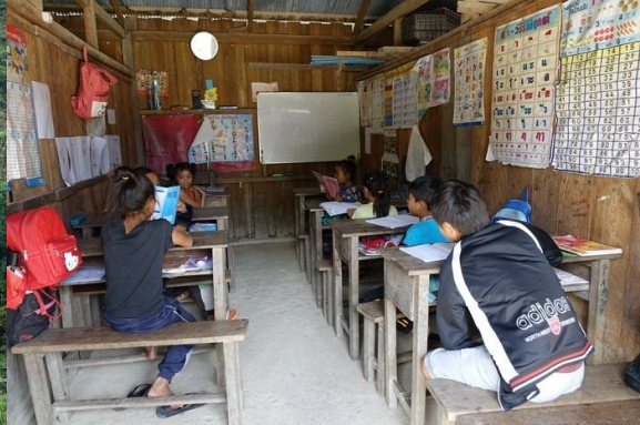
โรงเรียนในค่ายผู้พลัดถิ่นคอตาย