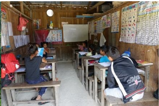
လွယ်လမ်ဒုက္ခသည်စခန်းစာသင်ကျောင်း