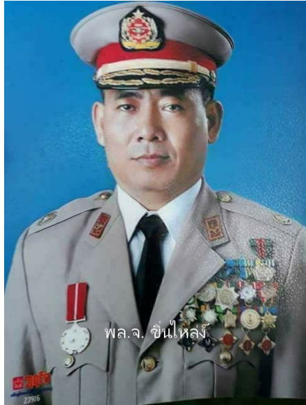
ဗိုလ်မှူးချုပ် ခင်လှိုင်

မိုင်းတုံရေကာတာသည် တရုတ်နှင့်ထိုင်းတို့ ပူးပေါင်းပြီး ရှမ်းပြည်ရှိ သံလွင်မြစ်ပေါ်တွင် တည်ဆောက်ရန် စီမံ လျက် ရှိသော ရေကာတာသုံးခုအနက်အ ကြီးဆုံးရေကာတာဖြစ်သည်။ လျှပ်စစ်အားမဂ္ဂဝပ် ၉၀% နှုန်း ကို ထိုင်းနိုင်ငံသို့ပို့ဆောင်မှာဖြစ်သည်။ မြန်မာနိုင်ငံ၏အာဏာရ NLD ပါတီ၏ ဗဟိုကော်မတီဝင် ၁၈ ဦး သည် ပြီးခဲ့သည့်လက ဖိတ်ကြားချက်အရ တရုတ်နိုင်ငံသို့သွား၍ Three Gorges ရေကာတာသို့ သွားခဲ့ သည်။