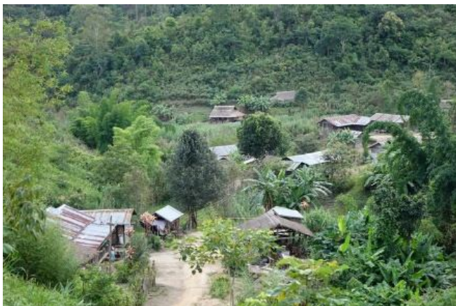
လွယ်လမ်ဒုက္ခသည်စခန်း

လွယ်လမ်စစ်ဘေးရှောင်ဒုက္ခသည်စခန်းသည် ရှမ်းပြည်တွင်းတိုက်ပွဲများကြောင့် ထွက်ပြေးတိမ်း ရှောင် လာသော ဒုက္ခသည်စခန်းများထဲကတခုဖြစ်သည်။ ထိုင်း-မြန်မာနယ်စပ် ဒုက္ခသည်စခန်းပေါင်း ၆ ခုရှိ သည်။ ဒုက္ခသည်ဦး ရေမှာ (၆၀၀၀)ကျော်ရှိသည်။ အများဆုံးမှာ အမျိုးသမီးများနှင့်ကလေး သူငယ်များ ဖြစ်ကြသည်။ စစ်ဘေးရှောင် ဒုက္ခသည်များအား ကူညီထောက်ပံ့နေကြသော ပြည်ပနိုင်ငံများမှ အလှူရှင် များသည် အောက်တိုဘာလ ၂၀၁၇ ခုနှစ် တွင်အကူအညီ ရပ်ဆိုင်းထားခဲ့သည်။ အစိုးရတပ် ဖန်တီးသော စစ်ပွဲများကြောင့် ရှမ်းပြည်နယ်တွင် စစ်ပွဲများ မငြိမ်သက်နိုင်သေးပါ။ ထိုကြောင့် ဤဒုက္ခသည်စခန်းမှ စစ်ဘေးရှောင်ဒုက္ခသည်များသည် မိမိတို့နေရပ်သို့ မပြန် နိုင်ကြသေးဘဲ သောင်တင်လျက်ရှိနေပါသည်။