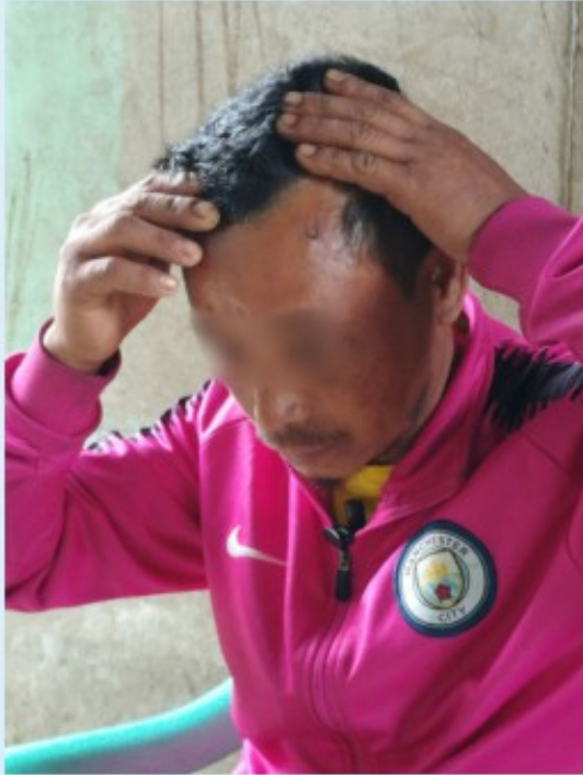
မြန်မာစစ်တပ်၏ ညှဉ်းပန်းနှိပ်စက်ခြင်းကို ခံခဲ့ရသော ကချင်တိုင်းရင်းသားတစ်ဦး (ခေါ်ပုံ KWAT)

အဆိုပါရွာသားက သူသည်တောထဲတွင်နေသူဖြစ်၍ သူ့အိမ်သို့ KIA စစ်သားများ တစ်ခါတရံ လာရောက်ကြသည်ဟု ပြောသည်။ သူ့ကို ညဘက်တွင် ချုပ်နှောင်ထားပြီး ရေနံစားစရာလည်း မပေးချေ။