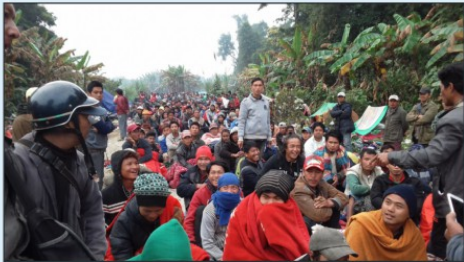
ပရင်းမော်တွင်ပိတ်မိနေစဉ်လမ်းဖွင့်ဖို့စောင့်နေကြသောပြည်သူများ

ရွာသားများအား မြန်မာစစ်တပ်မှ ဗုံးကြဲတိုက်ခိုက်ပြီးနောက် ရွာသား ၅ ဦး ဒဏ်ရာရရှိသွားသည်။ မိသားစုဝင်အချို့ တစ်နင်းရှိ ပယင်းမှော်တွင် သွားရောက် အလုပ်လုပ်စဉ် ကျန်ရစ်သူများက သစ်သားအိမ်အတွင်း နေထိုင်ကြစဉ် တိုက်ခိုက်ခံရခြင်းဖြစ်သည်။ တိုက်ခိုက်ခံရသူများမှာ အသက် ၁၈ နှစ်နှင့် ၃၁ နှစ် ရှိ ညီအမနှစ်ဦး၊ အသက် ၁၈ နှစ် လူငယ်တဦးနှင့် ကလေးနှစ်ဦး တို့ဖြစ်သည်။ ၎င်းတို့မှာ တွေ့ဆုံမေးမြန်းမှု ပြုနေစဉ်အတွင်း ရွာမှ ၄ နာရီခန့်ဝေးသည့် ဆေးခန်းတွင် ဆေးကုသမှု ခံယူနေရသည်။