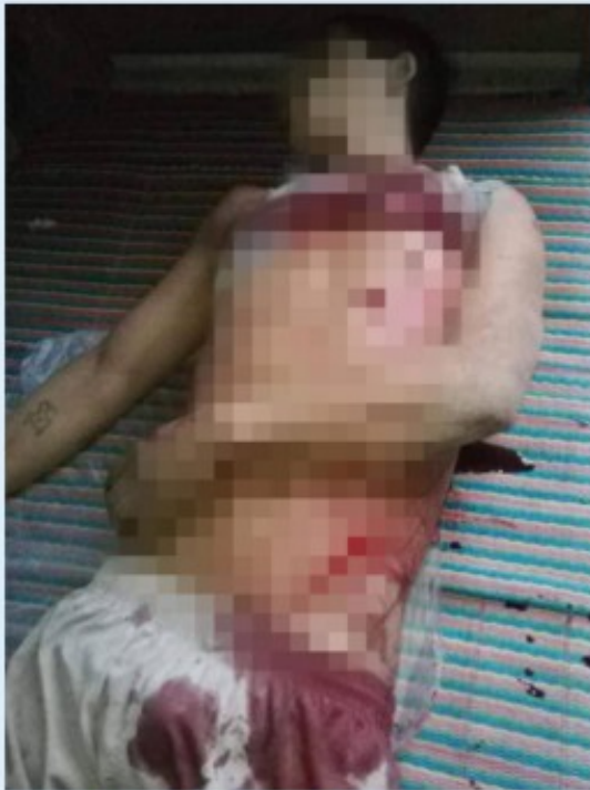
အောင်လွတ်တွင် ဗမာ့တပ်မတော် လေယာဉ်မှ လက်နက်ကြီးပစ်ခတ်သောကြောင့်သေဆုံးသွားသူ အသက် (၂၁)ရှိ ကချင်တိုင်းရင်းသားတစ်ဦး ခေါ်ပုံ (KWAT)

တိုက်ပွဲကြားမှ ထွက်ပြေးလာသူ အသက် ၅၇ နှစ်ရှိ ကချင် အမျိုးသားတစ်ဦးအား ND-Burma မှ တွေ့ဆုံမေးမြန်းရာ တိုက်လေယာဉ်များသည် သတိပေးမှု တစ်ခုတည်းမလုပ်ပဲ ရွာအတွင်းသို့ ဝင်ကြပြီး သေနတ်ဖြင့်ပစ်ခတ်တိုက်ခိုက်ခဲ့သည်။ ၁၃ ရွာသားများကို ရည်ရွယ်ချက်ရှိရှိ ပစ်မှတ်ထား တိုက်ခိုက်ခြင်းဖြင့် KIA စစ်သားများ ထွက်လာမည်ဟု ၎င်းကပြောသည်။