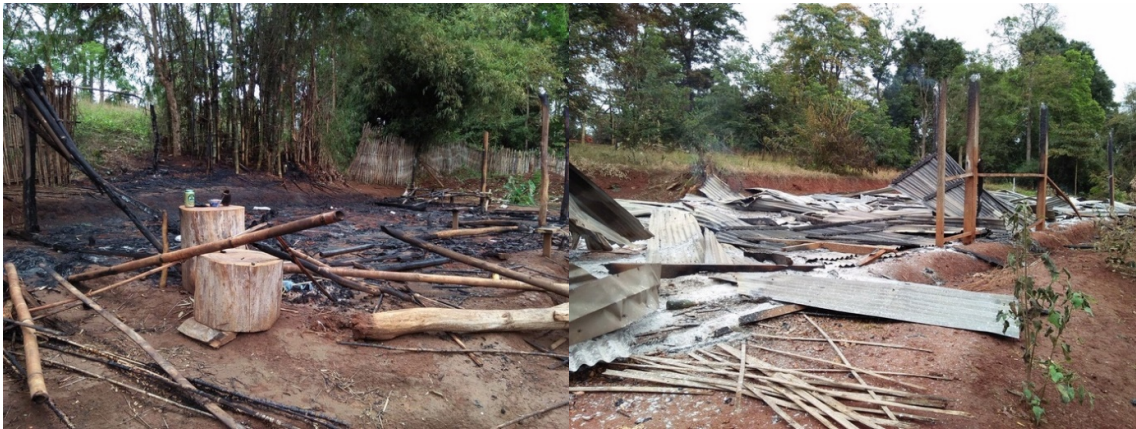
မူးယစ်ဆေးဖြတ် စခန်းအား အစိုးရစစ်တပ်က မီးရှို့ဖျက်ဆီး

နမ့်ယမ်ရွာရှိ ရှမ်းပြည်တိုးတက်ရေးပါတီ/ ရှမ်းပြည်တပ်မတော်(SSPP/SSA)၏ မူးယစ်ဆေးဖြတ်ဗဟိုဌာန စစ်စခန်းအား တိုက်ခိုက် ဖျက်ဆီး မီးရှို့ခဲ့ပြီးသည့်နောက် ထိုဒီဇင်ဘာလ ၃၁ ရက်နေ့ည သန်းခေါင်ယံ အချိန်တွင် ထိုအစိုးရစစ်တပ် စစ်ကြောင်းသည် နမ့်ယမ်ရွာမှ ပြန်လည်ဆုတ်ခွါခဲ့ပါသည်။ အစိုးရစစ်တပ် စစ်ကြောင်းသည် အနောက်စူးစူးသို့ဦးတည်၍ ဝမ်ဟမ်ဟျိုးရွာကို ဖြတ်သန်းကာ ကုန်းယုန်းရွာသို့