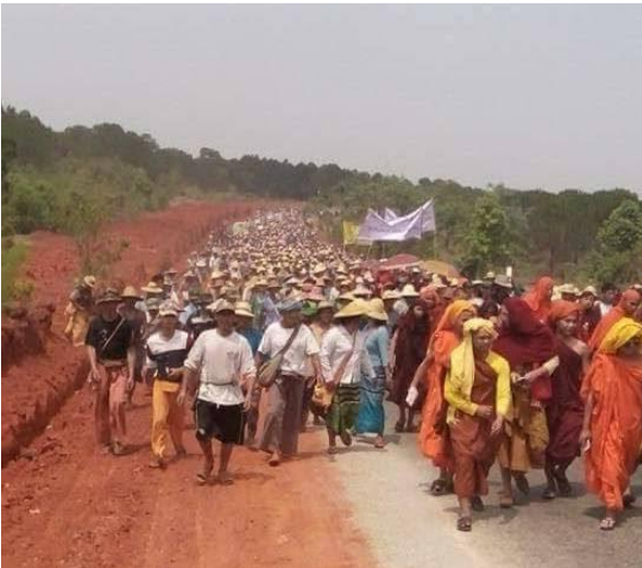
ဧပြီလ ၁၁ ရက်နေ့ ၂၀၁၇ တွင် ဒေသခံပြည်သူလူထုများ ကန်ကွက်ဆန္ဒပြနေသည့်ပုံ

ဧပြီလ ၁၁၊ ၂၀၁၇ တွင် ဒေသခံရွာသူရွာသား၊ ဘုန်းကြီး၊ ဒေသခံအာဏာပိုင် နှင့် လင်းစိုင်းလင် SNLD လွတ်တော်ကိုယ်စားလှယ်အမတ်တို့ ပါဝင်သောလူအင်အား ၄၀၀၀ ခန့် ဖြင့်ဆန္ဒ ပြသည်။ မိုင်းကိုင်းမြို့ ရှိမွေတော်စေတီတော်ကျောင်းတွင် ဦးစွာစုစည်းပြီးကျောက်မီးသွေးလုပ်ငန်းခွင် နှင့်နီးသောဝမ်လွယ်ရှိ ၊ ဝမ်ယတ် မြောက်ဘက်ရှိ နတ်နန်းဆီသို့ဦးတည်ခဲ့သည်။ ထိုနတ်နန်းတွင် ဒေသခံများ၏ဆန့်ကျင်မှုကိုမနားထောင်သောသူတို့ကို ကျိန်ဆဲသည့်အခမ်းအနားကျင်းပခဲ့သည်။ ပြီးတော့ ကျောင်းမီးသွေး လုပ်ငန်းခွင်သို့ ဦးတည်ခဲ့သည်။