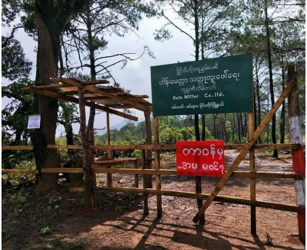
ကုမ္ပဏီမှ ပြုလုပ်လိုက်သော စစ်ဆေးရေးဂိတ်

ဆန္ဒပြပွဲဦးဆောင်သူကအကြမ်းမဖက်ပဲဆန္ဒပြဖို့သတိပေးထားသော်လဲထိုလုပ်ငန်းခွင်သို့ရောက်သွား သည်နှင့် အချို့သောဆန္ဒပြသူများက ကုမ္ပဏီပိုင်ကားများကိုရိုက်ခွဲဖျက်စီးခြင်းများပြုလုပ်ခဲ့သည်။