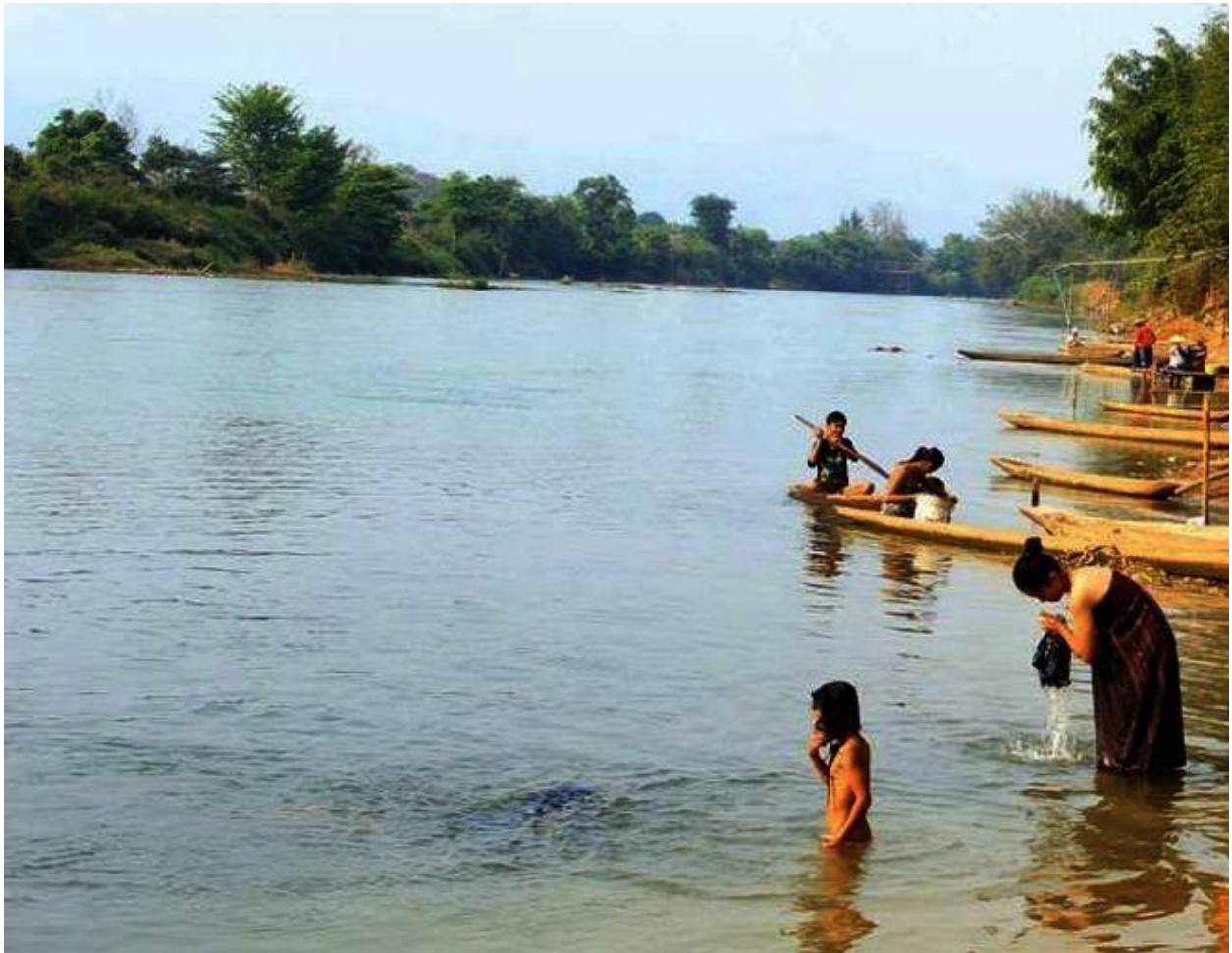
ရှမ်းပြည်နယ်တောင်ပိုင်း တွင်းရှိ တိန်းချောင်းမြစ်

ကျောက်မီးသွေးများကိုတင်ပို့သွားလာခြင်းမရှိသေးသော်လည်း အစီးရေ ၁၀၀ ကျော်သော ၁၀ ဘီးကားများ ရွာထဲသို့ဖြတ်သန်းသွားလာ ၍ လေထုညစ်ညမ်းခြင်း၊ လမ်းများပျက်စီးခြင်း၊ လမ်းလုံခြုံမှု မရှိခြင်းတို့ဖြစ်မှာကို စိုးရိမ်နေကြသည်။ ကျောက်မီးသွေးများကို ဘယ်နေရာသို့ သယ်ယူပို့ဆောင်မည် ကို အတိအကျမသိသေးသော်လဲရှမ်းပြည်နယ်မြောက်ပိုင်းလားရှိုး နှင့်ကျောက်မဲဘက်သို့ ပို့မည်ဟုကောလဟာလထွက်ပေါ်နေသည်။