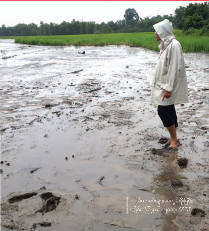
လယ်ယာခင်းများရေလွှမ်းမိုးခြင်း၊ ကချိုင်းတုံ့ပြန်မှု၊ ၂၀၁၃။ SSDF

နိုင်ငံတကာ အကူအညီပေးရေး အဖွဲ့အစည်းများအနေဖြင့်လည်း၊ ယခုကဲ့သို့ ပဋိပက္ခအသွင်ကူးပြောင်း ဖြစ်ပေါ်တိုးတက်သည့် အနေအထားတွင် ကြုံတွေ့ကြုံရသည့် စိန်ခေါ်မှုပြဿနာမှာ အခြေခံလိုအပ်ချက်များကို တုံ့ပြန်ကူညီပေးနေသည့် အနေအထားမှ၊ ကာကွယ်ပေးမှုဆိုင်ရာကိစ္စများဖက်သို့ ပို၍အလေးထား ရွှေ့ပြောင်း လာရခြင်းပင် ဖြစ်ပါသည်။ အထူးသဖြင့် နိုင်ငံတော်အစိုးရ၏ တရားဝင်မှုသည် အငြင်းပွားဖွယ်ရှိနေဆဲကာလတွင် ဖြစ်ပါသည်။ ယင်းကာလမျိုးတွင် ဖွံ့ဖြိုးမှုအတွက် သမားရိုးကျ ရည်ရွယ်ချက်များဖြစ်သည့် လူသားချင်းစာနာမှု အထောက်အပံ့များ ပိုမိုတိုးချဲ့ပေးနိုင်ရေး၊ အစိုးရ၏ စွမ်းဆောင်ရည်များ ခိုင်မာသန်စွမ်းအောင် ကြိုးပမ်းရေး စသည့်လုပ်ငန်းများမှာ ငြိမ်းချမ်းရေးလုပ်ငန်းစဉ်အတွင်း ဒေသန္တရအစိုးရများအကြား ယုံကြည်မှုတည်ဆောက်ရေး လုပ်ငန်းများအပေါ် ဆန့်ကျင်သည့်ရလဒ်များလည်း ဖြစ်ပေါ်နိုင်ပါသည်။ မြန်မာနိုင်ငံ အရှေ့တောင်ပိုင်းဒေသရှိ မြို့နယ်များနှင့် လုပ်ငန်းကဏ္ဍ ပေါင်းစုံတွင် ထိခိုက်နစ်နာဖွယ်အကြောင်းများ ရေရှည်တည်ရှိနေသည်ကို တွေ့ရ သော်လည်း၊ အလွန်ကြုံကြံခံနိုင်သည့် လူမှုအဖွဲ့အစည်းများဟု ဆိုနိုင်ပါသည်။ ငြိမ်းချမ်းရေးလုပ်ငန်းစဉ်အတွင်း အကူအညီပေးရေး အဖွဲ့အစည်းများက လူမှုရေး အရင်းအမြစ်များ ဖွံ့ဖြိုးလာစေရေး ကူညီပံ့ပိုးပေးသွားရန် မရှိမဖြစ် လိုအပ်ပါသည်။ သို့မဟုတ် အနည်းဆုံးအနေနှင့် ဒေသခံလူထုများ၏ ရင်ဆိုင်ရပ်တည်ရေး မဟာဗျူဟာ များအပေါ်တွင် သေချာမပြင်ဆင်ထားသည့် အစီအစဉ်များကြောင့် ဆိုးကျိုးဆုတ်ယုတ်မှု များ မဖြစ်ပေါ်စေသင့်ကြောင်း တင်ပြရပါသည်။