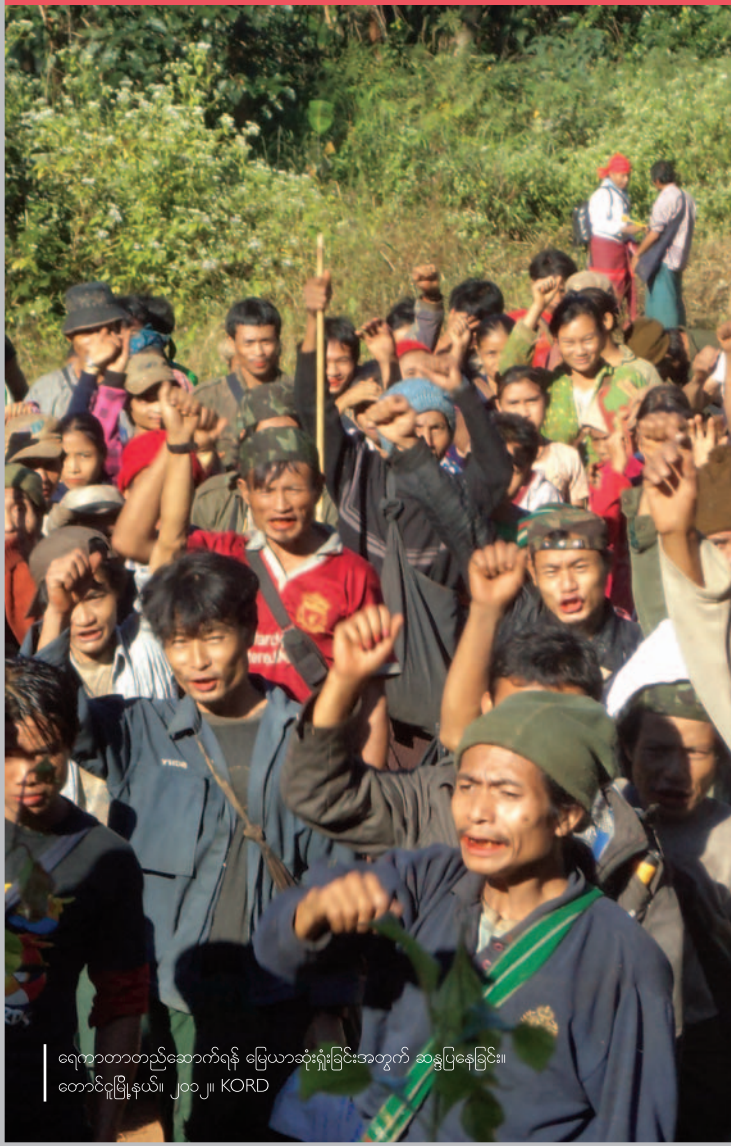
ရေကာတာတည်ဆောက်ရန် မြေယာဆုံးရှုံးခြင်းအတွက် ဆန္ဒပြနေခြင်း။ တောင်ငူမြို့နယ်၊ ၂၀၁၂၊ KORD

နယ်စပ်ရှိ အကူအညီပေးရေးညွှန်ပေါင်း အဖွဲ့ကြီး The Border Consortium (TBC) က အရပ်ဖက် လူမှုအဖွဲ့အစည်း ၁၁ဖွဲ့နှင့် ပူးပေါင်းဆောင်ရွက်၍ စစ်တမ်းကောက်ယူ အကဲဖြတ်မှုအတွက် ပုံစံစီမံခန့်ခွဲထုတ်လုပ်ခြင်း၊ စစ်တမ်းကောက်ယူလေ့လာခြင်းများကို ဆောင်ရွက်ခဲ့ပါသည်။ ပြည်နယ် ၄ ခု နှင့် တိုင်းဒေသကြီး ၂ ခုအတွင်းရှိ မြို့နယ် ၂၂ မြို့နယ်အတွင်း ပြန့်ကျဲတည်ရှိနေသော ကျေးရွာ ၂၀၉ ရွာတွင် စစ်တမ်းကောက်ယူမှု ပြုနိုင်ခဲ့ပါသည်။ အထူးသဖြင့် စစ်ပွဲများကြောင့် မအေးချမ်းသေးသော ဒေသများတွင် အစိုးရဖမ်းဆီးသည့် ကျေးရွာစာရင်း မပြည့်စုံမှုကြောင့် နမူနာပုံစံထုတ်ရာတွင် မပြည့်စုံမှုများ ရှိခဲ့ပြီး၊ တွင်းဆင်း စစ်တမ်းကောက်ယူသည့် ဝန်ထမ်းများကို ကျေးရွာအုပ်စုတစ်ခုမှ ထင်ရှားသည့်ရွာတစ်ရွာကို ရွေးချယ်ရန် ညွှန်ကြားခဲ့ပါသည်။ စစ်တမ်းကောက်ယူခဲ့သည့် ကျေးရွာများအနက် တစ်ဝက်ခန့်မှာ အစိုးရပဟတ်သည့် တိုင်းရင်းသားလက်နက်ကိုင်အဖွဲ့အစည်းများက တစ်စုံတရာ အတိုင်းအတာဖြင့် စီမံအုပ်ချုပ်နေကြပါသည်။ ၆ ရာခိုင်နှုန်းသော ကျေးရွာများသာ မကြာသေးမီက ကုလသမဂ္ဂ နှင့် အခြားအစိုးရမဟုတ်သည့် အဖွဲ့အစည်းများ ကူညီပံ့ပိုးပေးမှုတွင် ပါဝင်ခံစားကြရပါသည်။