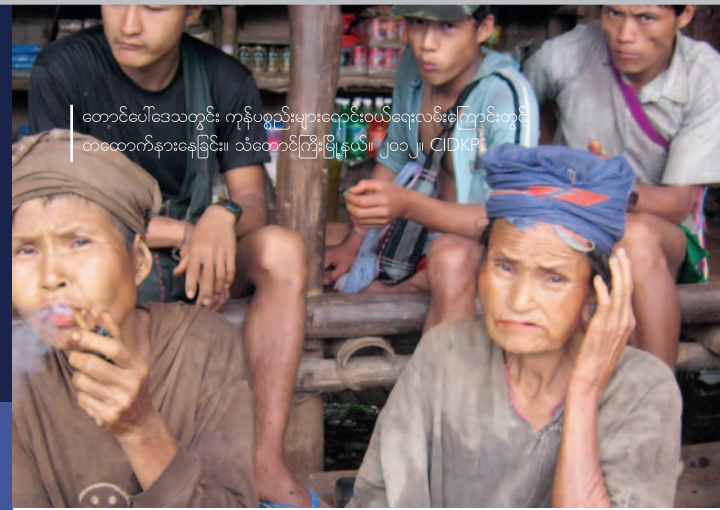
တောင်ပေါ်ဒေသတွင်း ကုန်ပစ္စည်းများဝင်သွင်းလမ်းကြောင်းတွင် တထောက်နားနေခြင်း။ သံတောင်ကြီးမြို့နယ်၊ ၂၀၁၂၊ CIDKP

၂၀၁၃ ခုနှစ်အတွင်း မြန်မာနိုင်ငံ၏ ပြုပြင်ပြောင်းလဲမှု အရှိန်အဟုန် နှေးကွေးလာခဲ့သော်လည်း၊ နိုင်ငံ၏ ပဋိပက္ခများ အဆုံးသတ်နိုင်စေရေး အတွက် အင်အားစုအားလုံးပါဝင်သည့် နိုင်ငံရေးတွေ့ဆုံဆွေးနွေးမှုပြုရန် အလားအလာ ပို၍တိုးတက်လာခဲ့ပါသည်။ အမျိုးသားပြန်လည် သင့်မြတ်ရေးလုပ်ငန်းစဉ် ရေရှည်တည်တံ့စေရန်အတွက် တိုင်းရင်းသားလူမျိုးများ၏ ကြန်အင်လက္ခဏာ၊ လုံခြုံရေး၊ တရားမျှတမှုတို့နှင့် သက်ဆိုင်သည့် လိုလားချက်၊ မျှော်မှန်းထားချက်၊ စိုးရိမ်ပူပန်မှုများ အပေါ်တွင် အလေးထားဆောင်ရွက်ရန် များစွာလိုအပ်ပါသည်။ ယခုကောက်ခံခဲ့သည့် ကျေးရွာအဆင့် စစ်တမ်းကောက်ယူမှုတွင် ဖြေရှင်းရမည့် စိန်ခေါ်မှုပြဿနာများဖြစ်သော ရေရှည်ဆင်းရဲမွဲတေမှု၊ ရေရှည်အိုးအိမ်ပြောင်းရွှေ့ထွက်ပြေးနေရမှု၊ အင်အားချိန်သည် အစိုးရအုပ်ချုပ်ရေးစနစ်တို့ကို မြန်မာနိုင်ငံ အရှေ့တောင်ပိုင်းဒေသတွင်၊ ပဋိပက္ခ အသွင်ကူးပြောင်း တိုးတက်မှုများနှင့် တစ်ချိန်တည်းတွင် တွေ့မြင်နေရပါသည်။